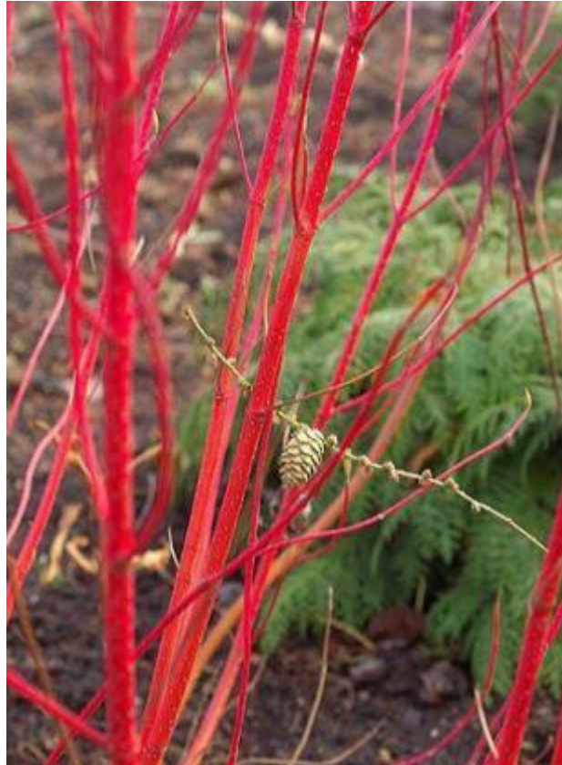
Cornus sanguinea « Baton rouge »