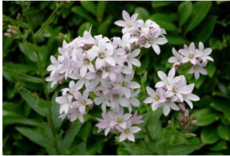
C. lactiflora « Loddon Anna »