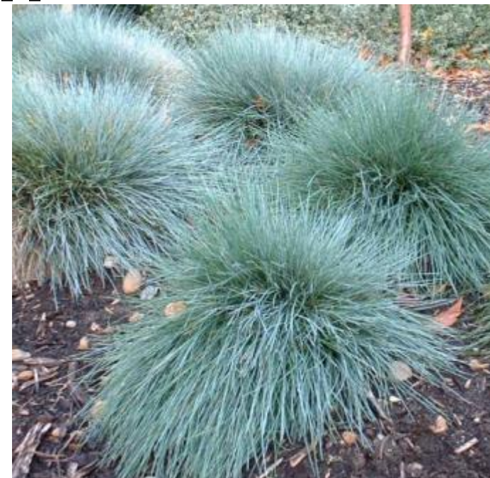
Festuca glauca « Elijah Blue »