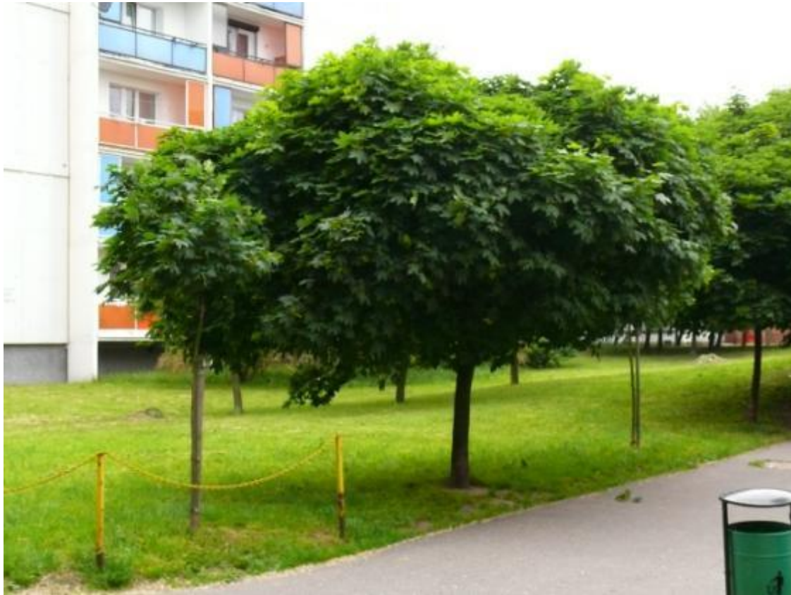
Acer platanoides « Globosum »