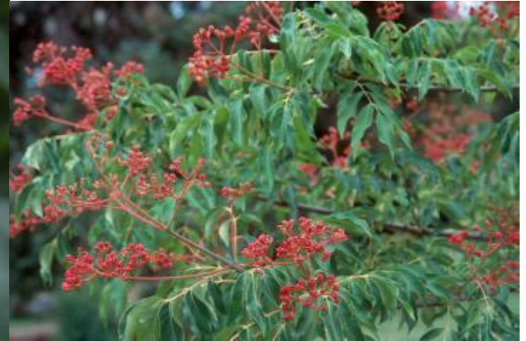
TETRADIUM DANIELLII OU ARBRE AUX CENT MILLES FLEURS OU ENCORE « BEE BEE TREE »