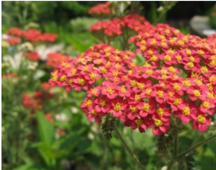
Achillea millefolium en de multiples couleurs