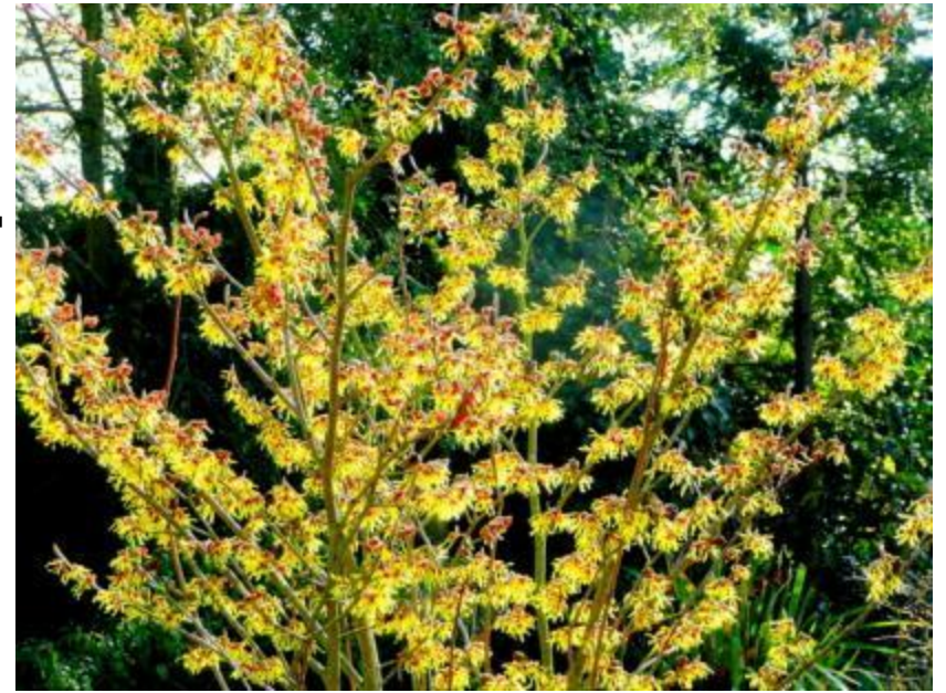
Hamamelis mol. « Arnold Promise »