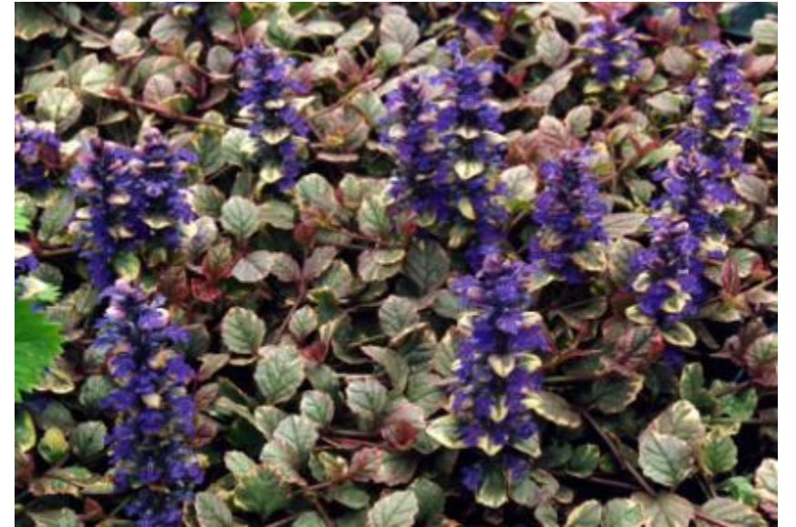
Ajuga reptans « Burgundy Glow »