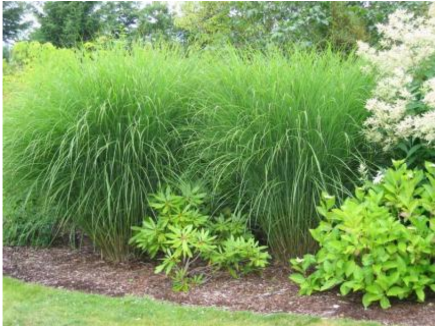
Miscanthus sin. Gracillimus