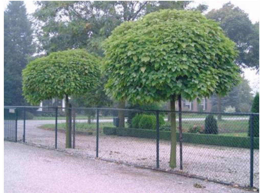
Catalpa bignonioides « Bungei »