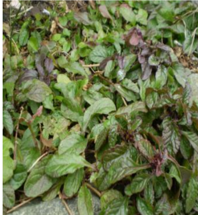
Ajuga reptans atropurpurea