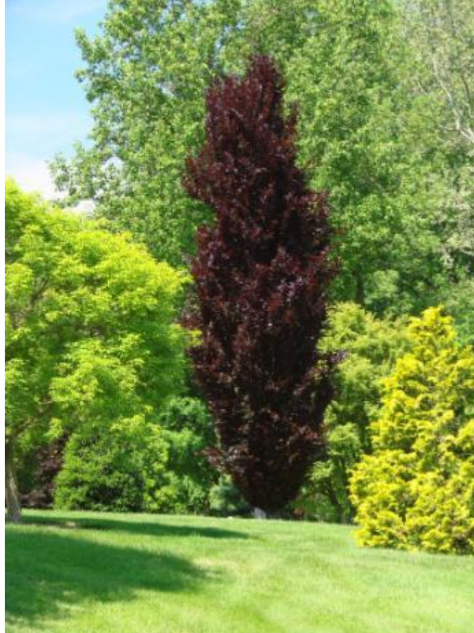
Fagus sylvatica « Dawyck Purple »