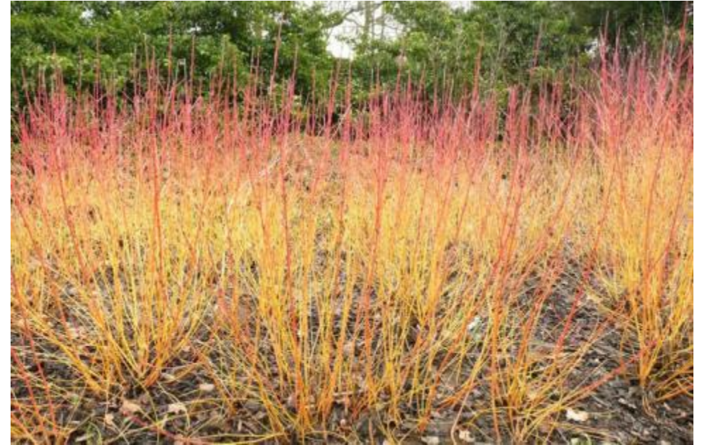
Cornus sanguinea « Winter Beauty »