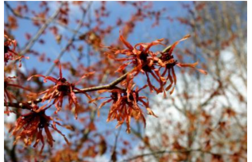
H.m. « Diane »