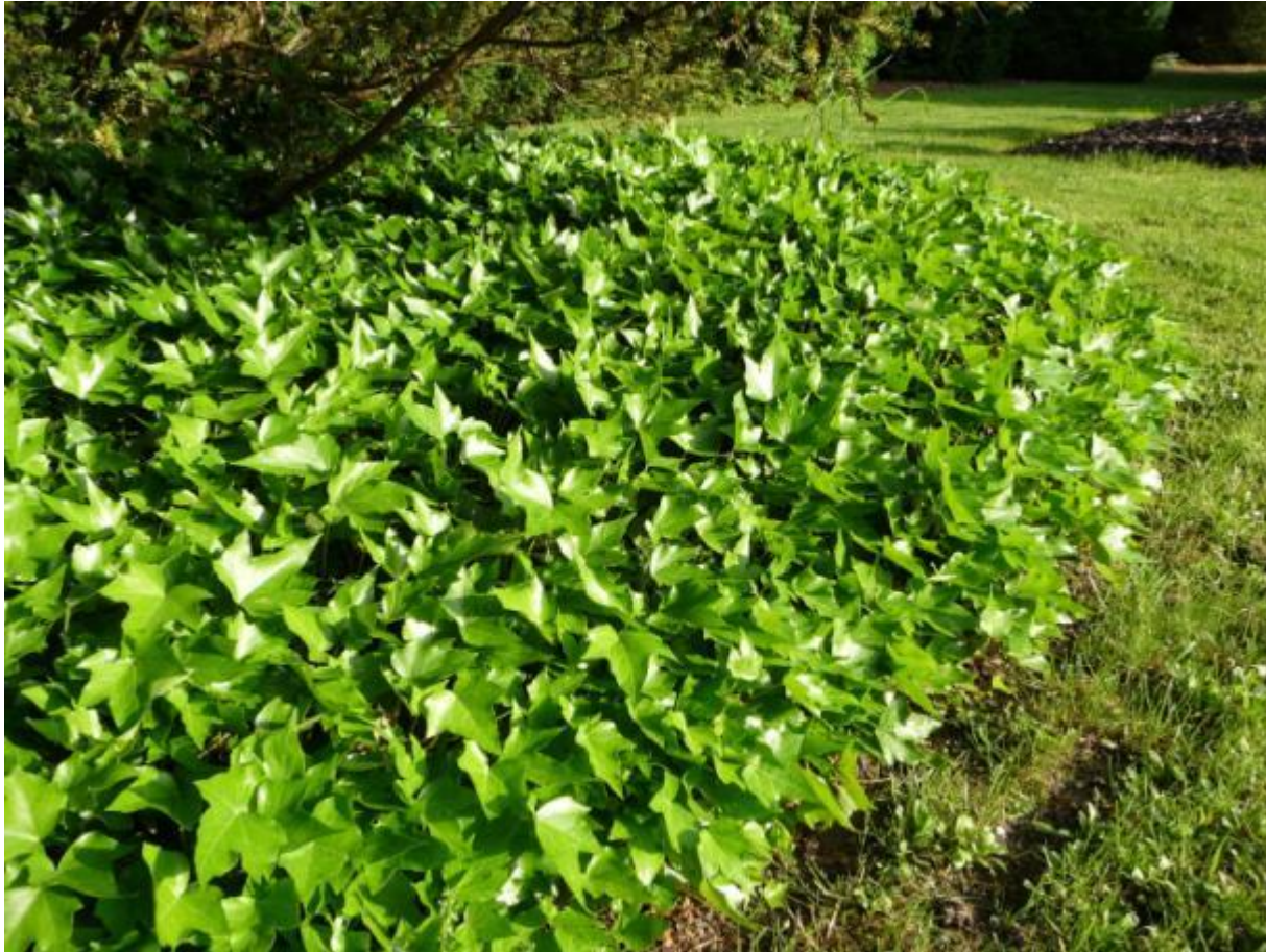
Hedera helix « Green Ripple »