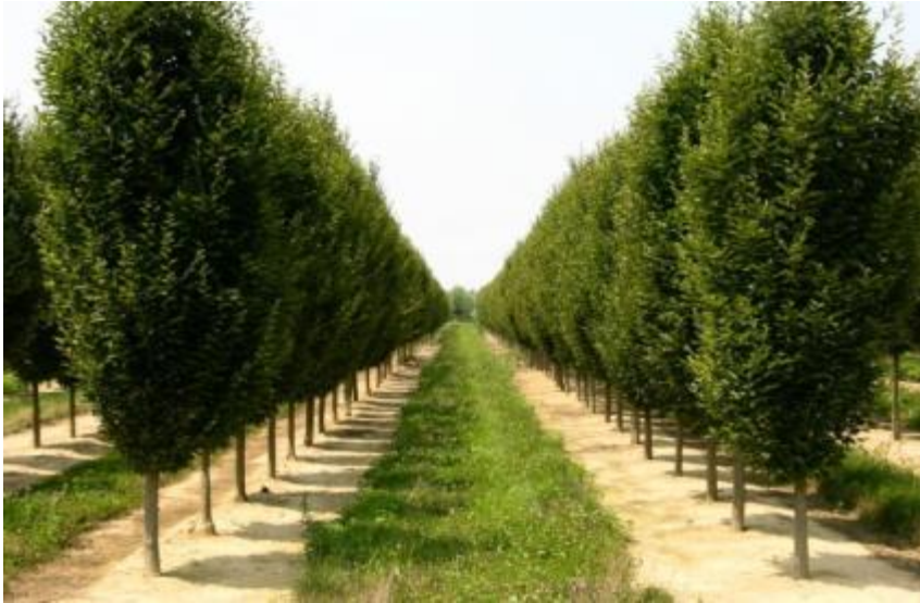
Carpinus betulus « Fastigiata »