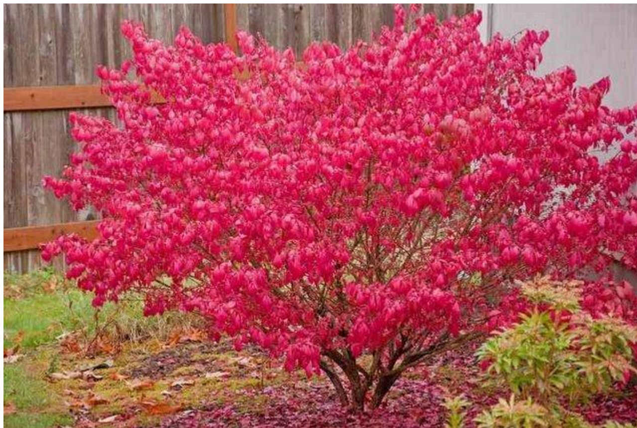
Euonymus ou fusain