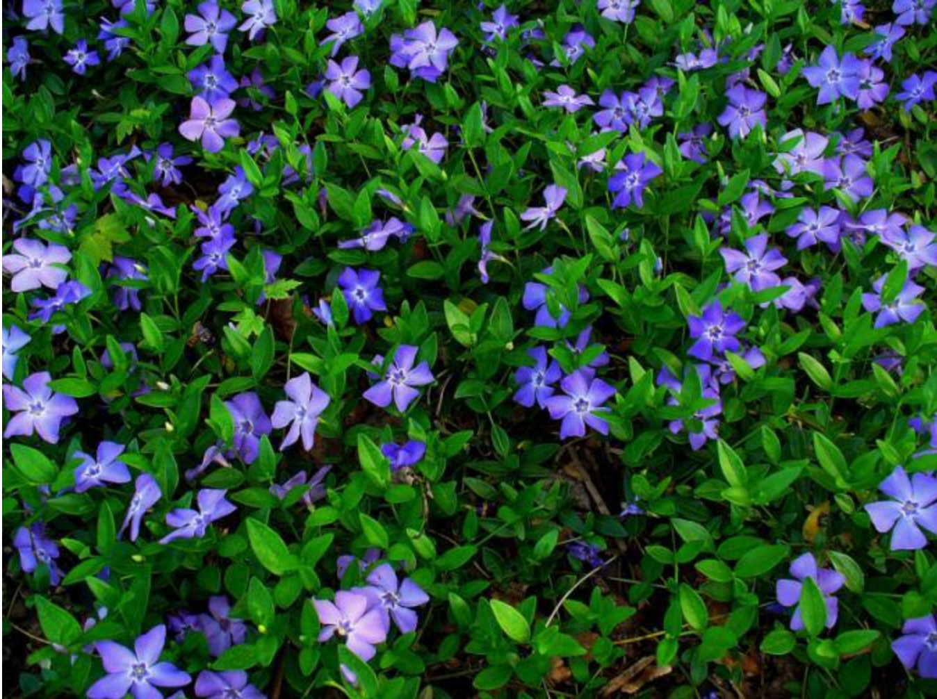
Vinca minor ou petite pervenche