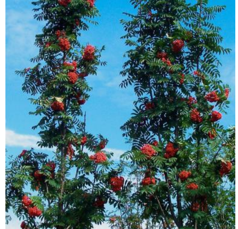
Sorbus aucuparia « Fastigiata »