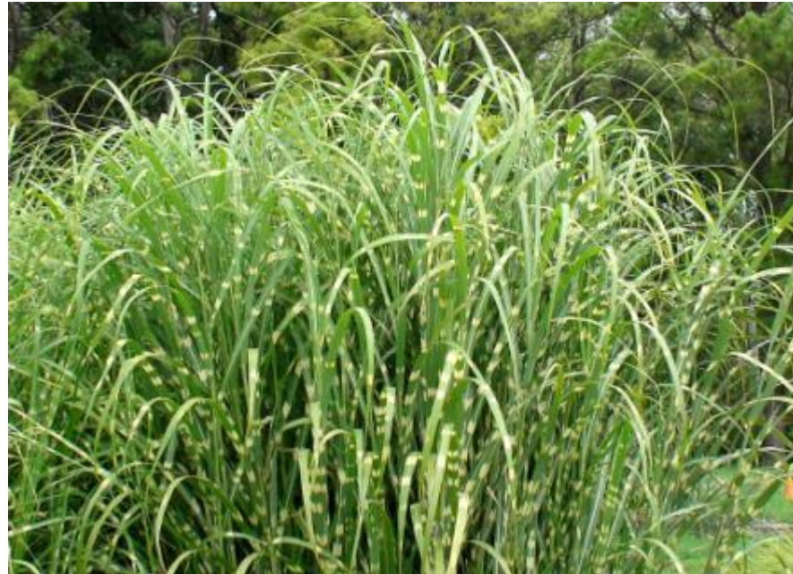
Miscanthus sin. Zebrinus