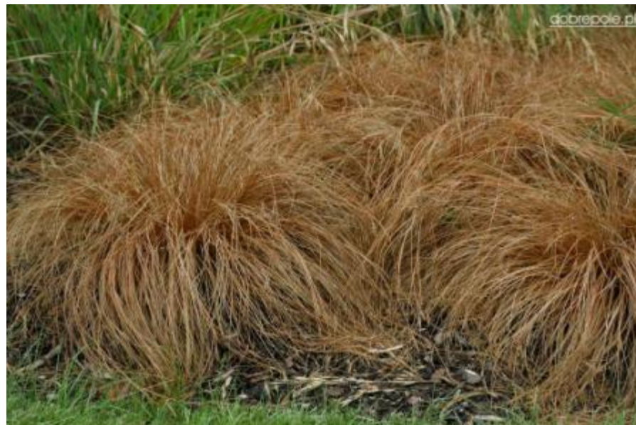
Carex comans « Bronze Form »