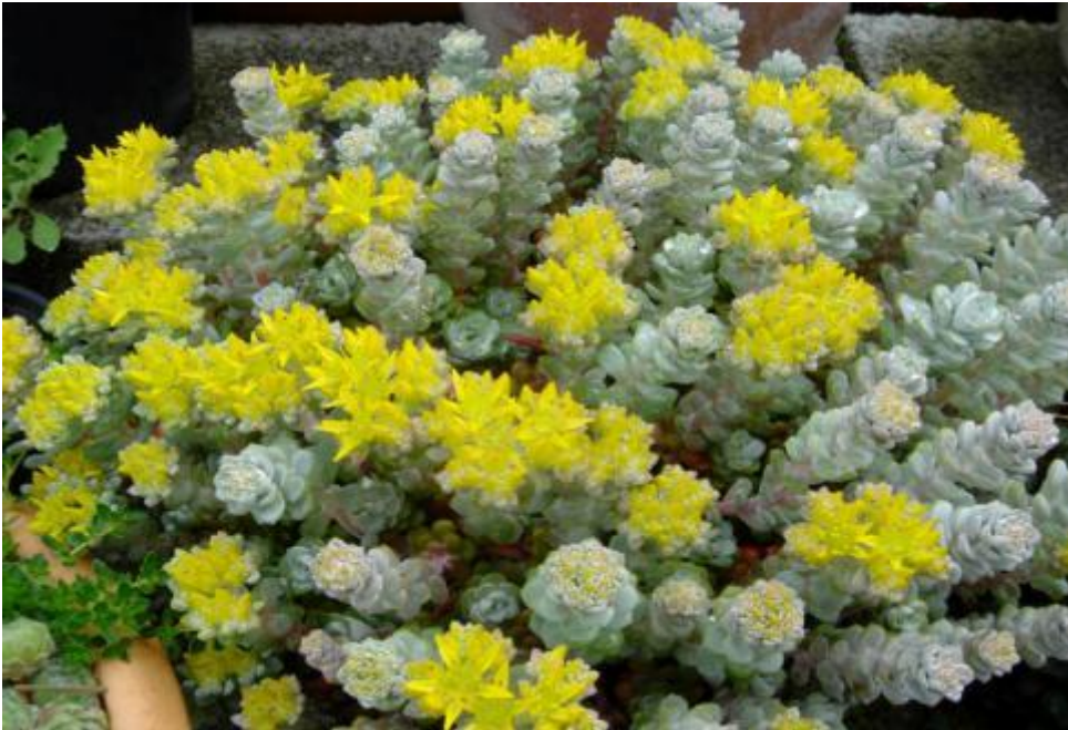
Sedum spathulifolium « Cappe Blanco »