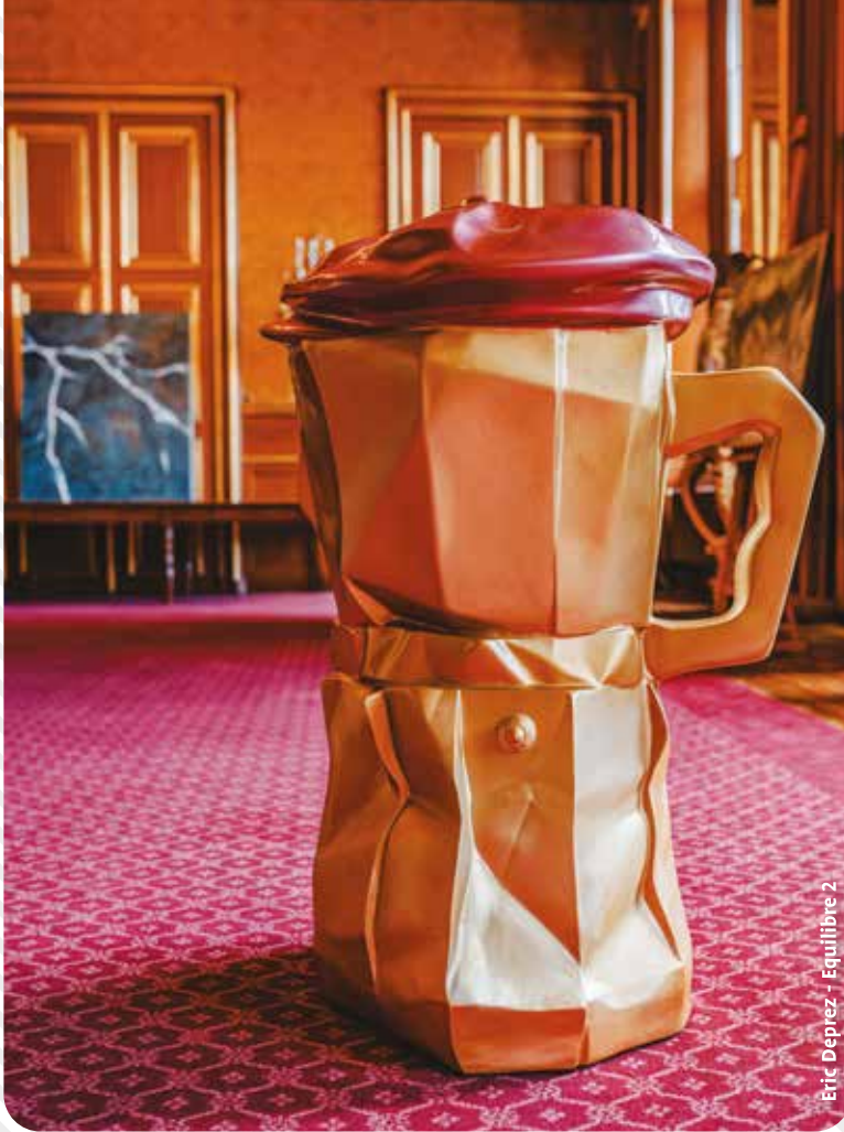
Eric Deprez - Equilibre 2