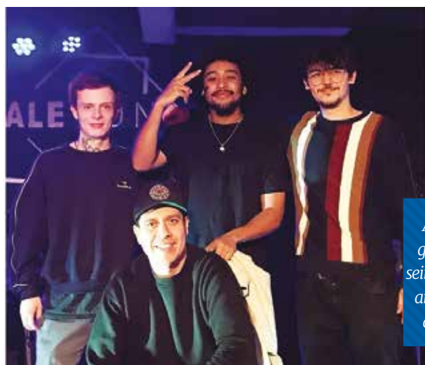
COACHING KAER X ONHA