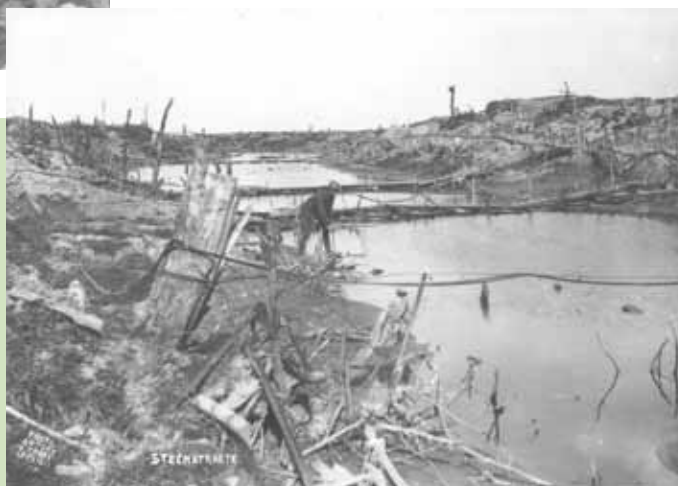
Paysage de tranchées à Steenstraete

Il connaîtra en outre, dans les premières lignes, le tir répété des mitrailleuses et la violence des assauts ennemis. Face à cette « pluie » d'obus, l'infanterie belge, ne disposant que de peu de moyens de protection, ne peut riposter. Le sentiment d'impuissance est total.