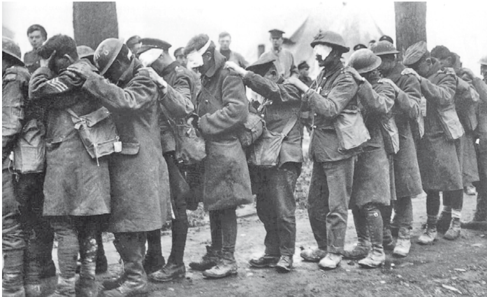
Soldats de la 55 e division britannique rendus aveugles par les gaz lacrymogènes à la bataille de la Lys en 1918

« Suis encore malade des gaz. Les poumons me font mal. J'ai la tête lourde. » (20/3/1918)