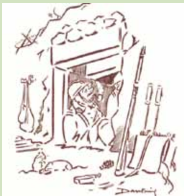
Dessin de Pierre Dantoine