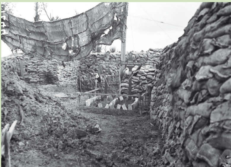
Photo de tombe à Steenstraete

« [...] Les boches ont capturé un poste de 20 hommes et ont aligné les cadavres devant les barbelés. Beaucoup de tombes d'Anglais enterrés à peu de profondeur : il pue. Les mouches marquent de tâches [sic] noires – tant il y en a – les tombes. Des souliers dépassent. Vais dans un trou d'obus peu profond et m'aperçois qu'un bras dépasse avec les chairs en décomposition. La croix est en miette. Dans un autre trou d'obus, je trouve un cadavre à demi rongé par les rats. En creusant un fossé, un autre donne la main à un mort ! » (25 au 26/6/1918)