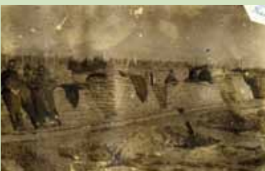
Tranchée de 3 e ligne à Dixmude