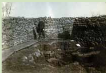
Boyau de communication

Les tranchées sont creusées le long des zones de front appelées « lignes ».