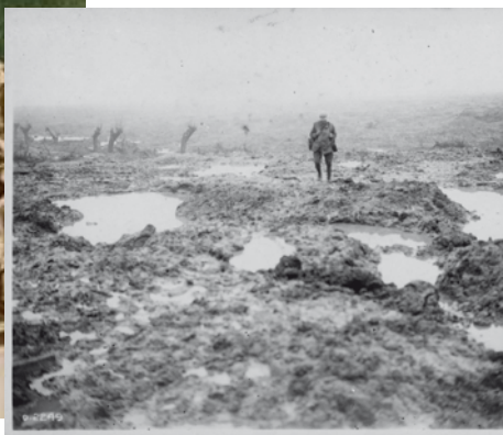
Champ de boue à Passchendaele

Un inconfort total règne tant dans les cantonnements que dans les tranchées.