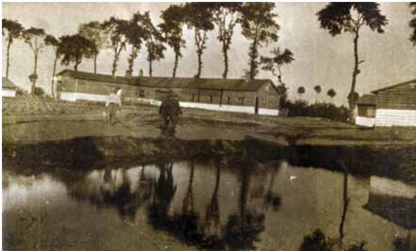
Baraquement de repos à l'arrière

Si la guerre sur l'Yser est une guerre de position, les soldats, eux, sont très souvent en mouvement.