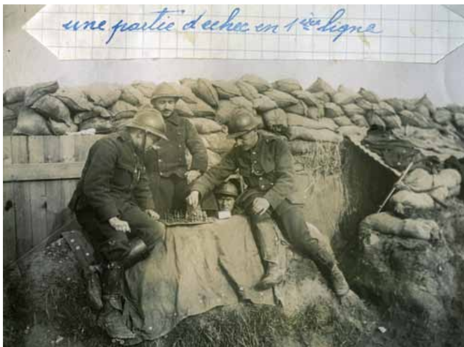
Partie d'échecs dans les tranchées

Or l'ennui est l'une des composantes de la vie des tranchées. En effet, la guerre de position confine le soldat dans un espace réduit où s'inscrivent de longues périodes d'attente et d'inactivité.