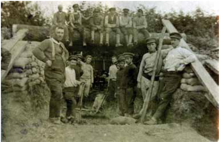
Construction d'un abri pour canons