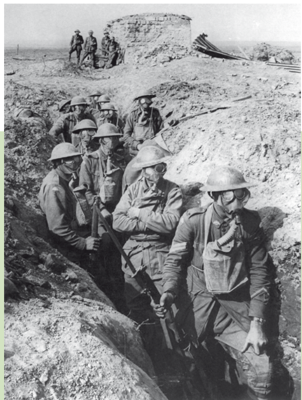
Troupes australiennes. Zonnebeke, secteur d'Ypres, 27 septembre 1917

Les boches bombardent notre 1 ère ligne et les boyaux. Vers 8h, nouvelle odeur piquante. Gaz lacrymogènes à nouveau. Les masques déjà usagés, sont impuissants à neutraliser le poison qui nous déchire les poumons, la gorge, les voies respiratoires. On éternue, les yeux, le nez coulent ; on transpire. Les souffrances sont intolérables ; on souhaite être morts pour en être quitte. Les gaz sont rejetés continuellement vers nous par le déplacement d'air des canons. Nous restons une heure et demie dans ces affres. On allume de petits feux de paille qui nous soulagent médiocrement.