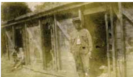
Front belge. Cachot

Sur la durée du conflit, 220 condamnations à mort seront prononcées, mais 12 sont exécutées (dont 4 pour insubordination et 5 pour abandon de poste) 54 .