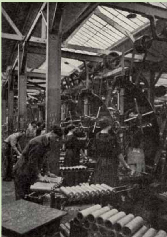
Usine de Graille. Fabrication de projectiles

Dès le début du conflit (août 1914), 18 000 volontaires viennent s'ajouter aux effectifs d'une armée belge qui restera toujours de taille très modeste (maximum 20 % de la population mobilisable, soit 117 500 hommes en août 1914).