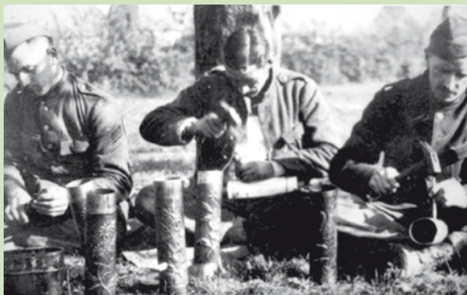
Soldats gravant des obus

Les soldats, dont beaucoup exerçaient un métier manuel dans la vie civile, s'occupent l'esprit en travaillant les innombrables débris de guerre. Ainsi apparaît, un véritable artisanat, si ce n'est un art, des tranchées : objets utilitaires (briquet, porte-plume, encrier, gamelle...), décoratifs (vases sculptés dans des douilles d'obus, bagues...), pieux (crucifix, chandeliers). Des souvenirs de batailles naissent des amas de métaux (cuivre-laiton-aluminium), de bois et de pierre laissés sur les lieux des combats.