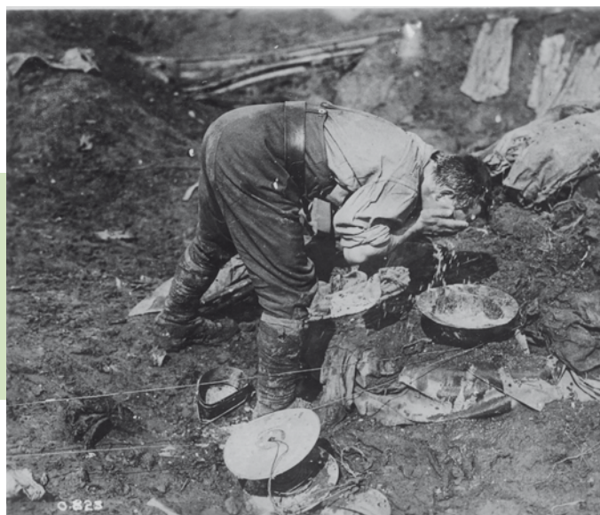
Soldat se lavant dans un casque