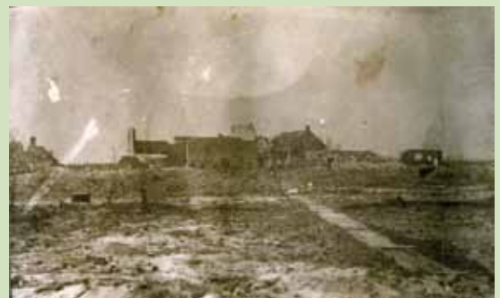
Ruines de Pervyse

De nombreux soldats belges seront soignés dans des hôpitaux psychiatriques. Envoyés dans un premier temps à l'hôpital militaire Saint-Emile à Calais, ils sont parfois redirigés dans des institutions situées à l'arrière du front, selon l'importance du traumatisme 39 .