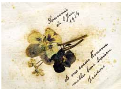
Souvenir de l'Yser

Notons enfin que les échanges épistolaires sont soumis à la censure militaire belge qui doit empêcher la transmission de tout renseignement pouvant compromettre le secret des opérations, nuire à la défense nationale, permettre l'accomplissement d'un délit ou dévoiler les moyens de correspondance ainsi que le nom des membres des organisations clandestines 45 .