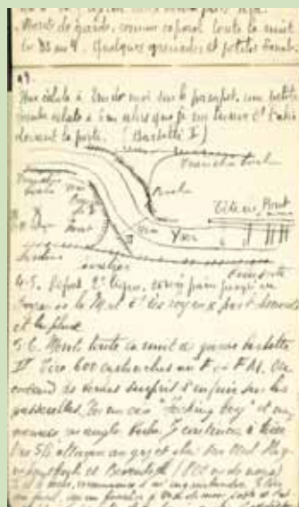
Croquis des tranchées

Elles sont reliées entre elles par des « voies de communication » étroites, les « boyaux ».