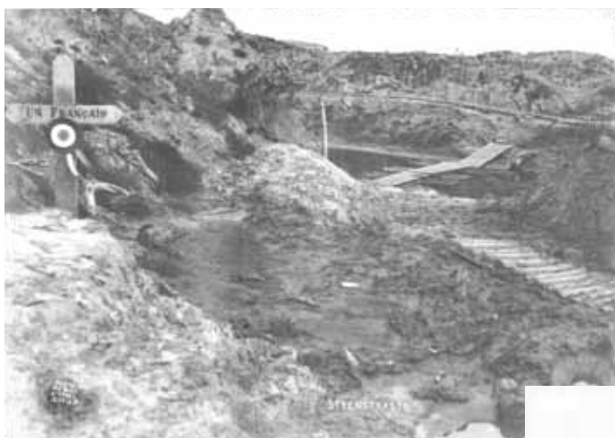
Paysage de tranchées à Steenstraete

S'il est une constante dans le récit de Jean d'Otreppe, c'est l'omniprésence, jour après jour, dans les tranchées comme dans les cantonnements, des combats aériens, des tirs d'obus et des bombardements auxquels il est soumis, vivant en permanence dans un bruit inouï et – même s'il n'en fait jamais état – avec un sentiment de peur qui devait peu le quitter.