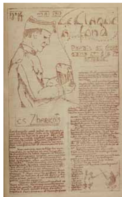
Une du Claque à fond : paraît au front belge de la 7 e brigade d'infanterie, n° 14 (mai 1917)

Enfin, des marraines de guerre (anglaises ou françaises) adoptent les soldats et leur soutiennent le moral par l'envoi de courrier et de colis. Toutefois, l'institution de la marraine de guerre va souffrir à la fin de la guerre d'une campagne de dénigrement. La marraine de guerre sera alors représentée comme une femme facile ou bien comme une « vieille fille » en quête d'un mari 47 .