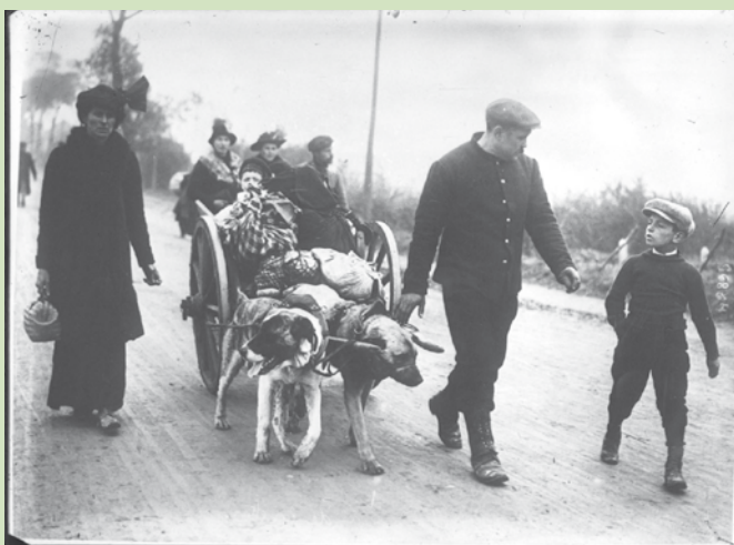
Fugitifs belges traversant le nord de la France

Dès août 1914, plus d'un million et demi de Belges prennent le chemin de l'exode, fuyant les combats et les exactions de l'ennemi. Ils se réfugient aux Pays-Bas (plus d'un million), en France (250 000) ou encore en Angleterre (de 150 000 à 200 000). Si certains font le choix de revenir en Belgique une fois l'invasion terminée, près de 600 000 réfugiés optent pour un exil prolongé dans ces pays. La plupart des exilés sont pauvres et désormais sans ressources. Ils survivent grâce à l'aide de nombreuses œuvres caritatives. À la libération, de nombreux réfugiés seront victimes de discrédit de la part des Belges restés pendant l'occupation, qui considèrent les exilés comme des fuyards et des « mauvais » patriotes (à l'exception des Belges exilés engagés dans l'armée de l'Yser), ayant abandonné le pays. Parmi les exilés, nombreux sont les ouvriers spécialisés recherchés pour leurs capacités de travail, notamment par les industries anglaise et française, frappées par une pénurie de main-d'œuvre 7 .