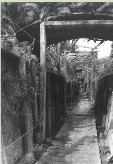
Tranchée en 1 er ligne