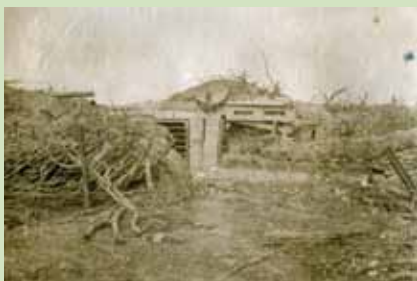
Abris à munitions après bombardement

L'obusite (ou, en anglais, shellshock ) se caractérisait par des nombreux symptômes tels que les tremblements convulsifs, la perte de la vue, la paralysie, l'état de prostration 38 .