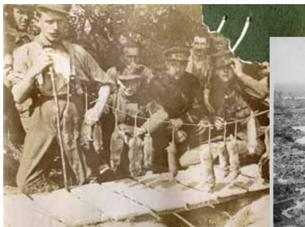
Une chasse aux rats

Un inconfort total règne tant dans les cantonnements que dans les tranchées.