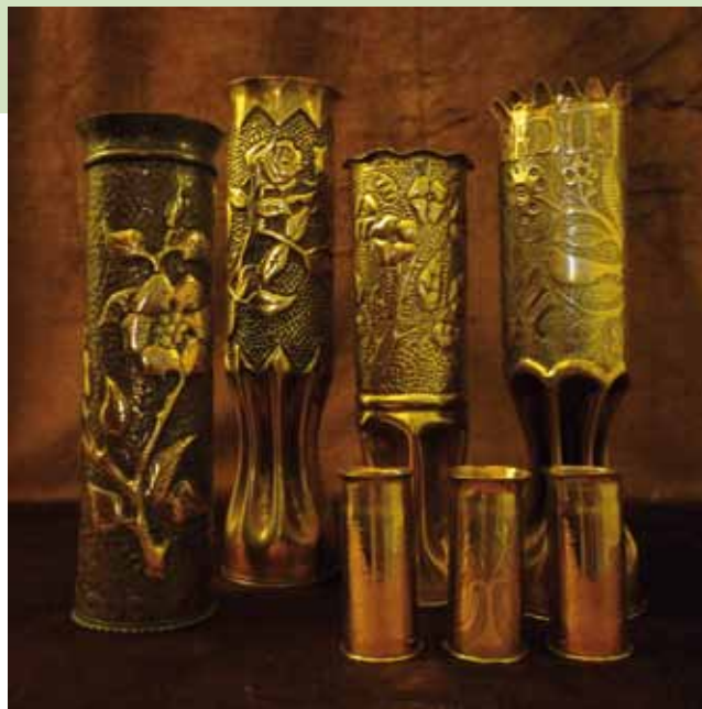
Artisanat de tranchée, douille d'obus

Ils sont parfois l'objet de troc entre soldats qui les acquièrent en échange d'autres biens (cigarettes par exemple) ou comme cadeaux futurs à leur famille.