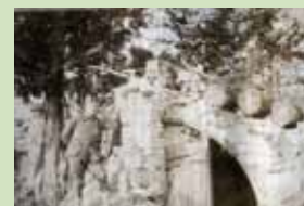
Abris section flanquante St Jacques-Capel