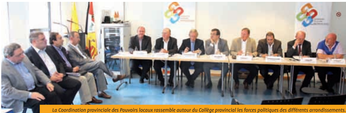
La Coordination provinciale des Pouvoirs locaux rassemble autour du Collège provincial les forces politiques des différents arrondissements.

Elle s'est réunie en juillet dernier pour poursuivre le travail de structuration de la supracommunauté sur notre territoire. Supracommunauté qui consiste donc à rassembler les différents arrondissements de la Province pour mener à bien, ensemble,