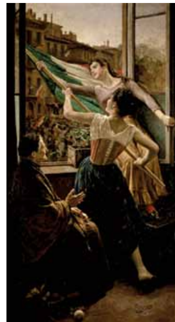
Une œuvre de 1848 qui illustre combien le combat pour l'unité italienne fut long.

openado orientation - prévention enfants - adolescents