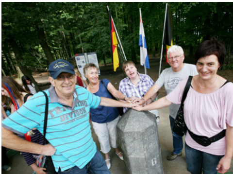
Le « Drielandenpunt » (Vaals), lieu où les frontières de l'Allemagne, de la Belgique et des Pays-Bas se rejoignent.

Le caractère unique de l'Euregio Meuse-Rhin découle de sa richesse culturelle, paysagère et linguistique avec cinq régions dans trois pays et trois langues. Elle est composée des provinces de Liège et du Limbourg ainsi que de la Communauté germanophone en Belgique, la région d'Aix-la-Chapelle avec les arrondissements de Düren, Euskirchen et Heinsberg en Allemagne et du sud de la province du Limbourg aux Pays-Bas. L'EMR s'engage activement dans la promotion de la coopération transfrontalière. L'un de ses symboles forts est l'empereur Charlemagne, considéré comme le premier réunificateur de l'Europe et qui avait fait d'Aix-la-Chapelle sa résidence préférée à la fin du 8 e siècle.