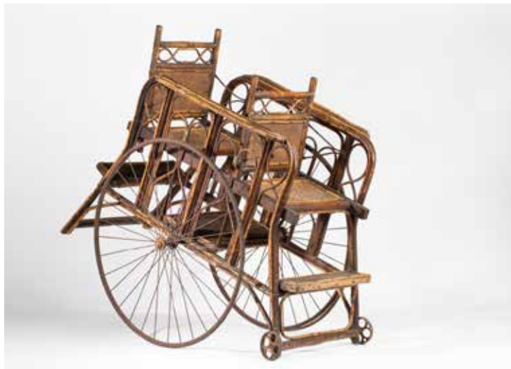
Landau à deux places Début XX e siècle