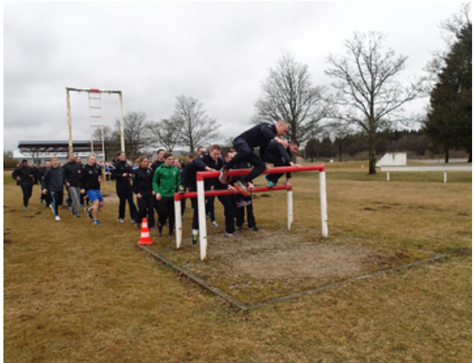
La sécurité et l'urgence, des métiers où une bonne condition physique est importante.