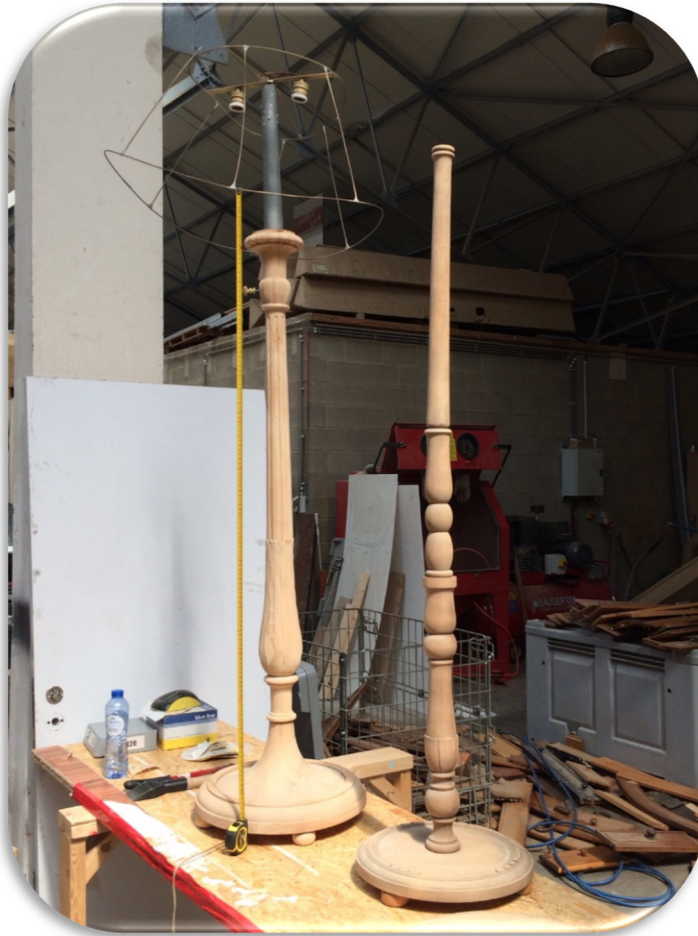
Préparation des pieds de lampe récupérés en vue de la réalisation des abat-jours