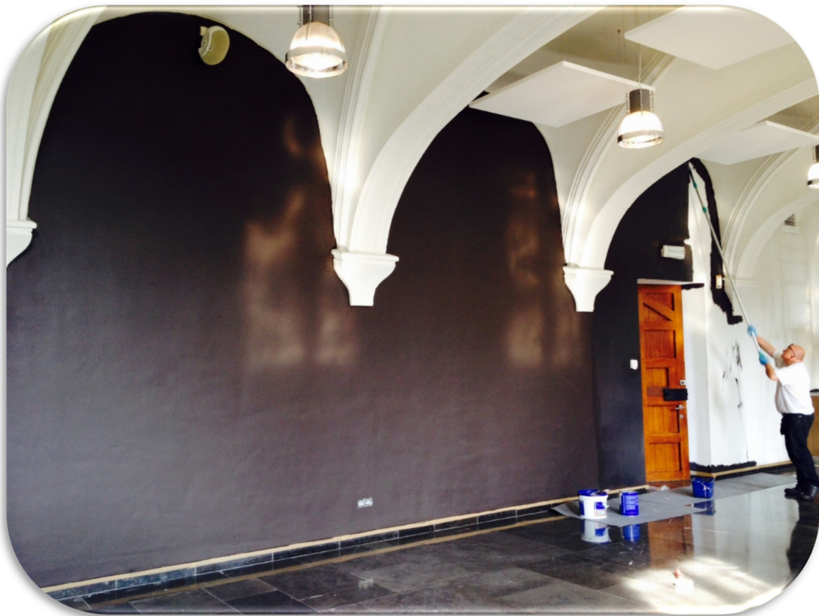
Mise en peinture