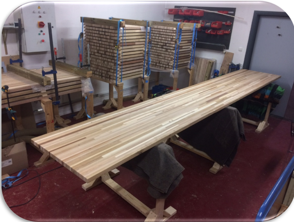
Panneaux des tables 2 places et panneau de la grande table centrale 14 places