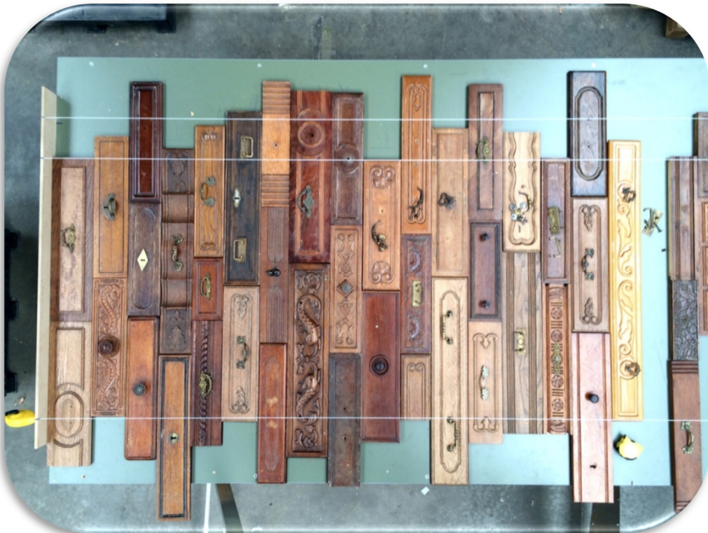
Sélection et disposition des faces de tiroirs récupérées pour la décoration du comptoir