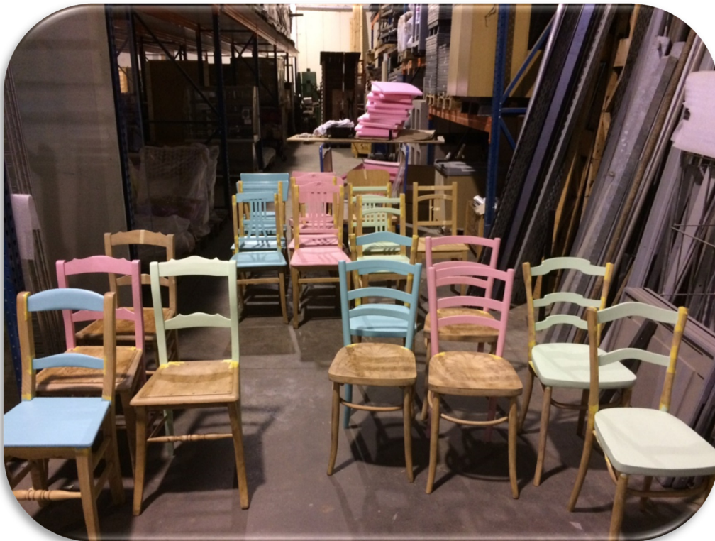
Chaises récupérées et aérographées en cours de mise en peinture