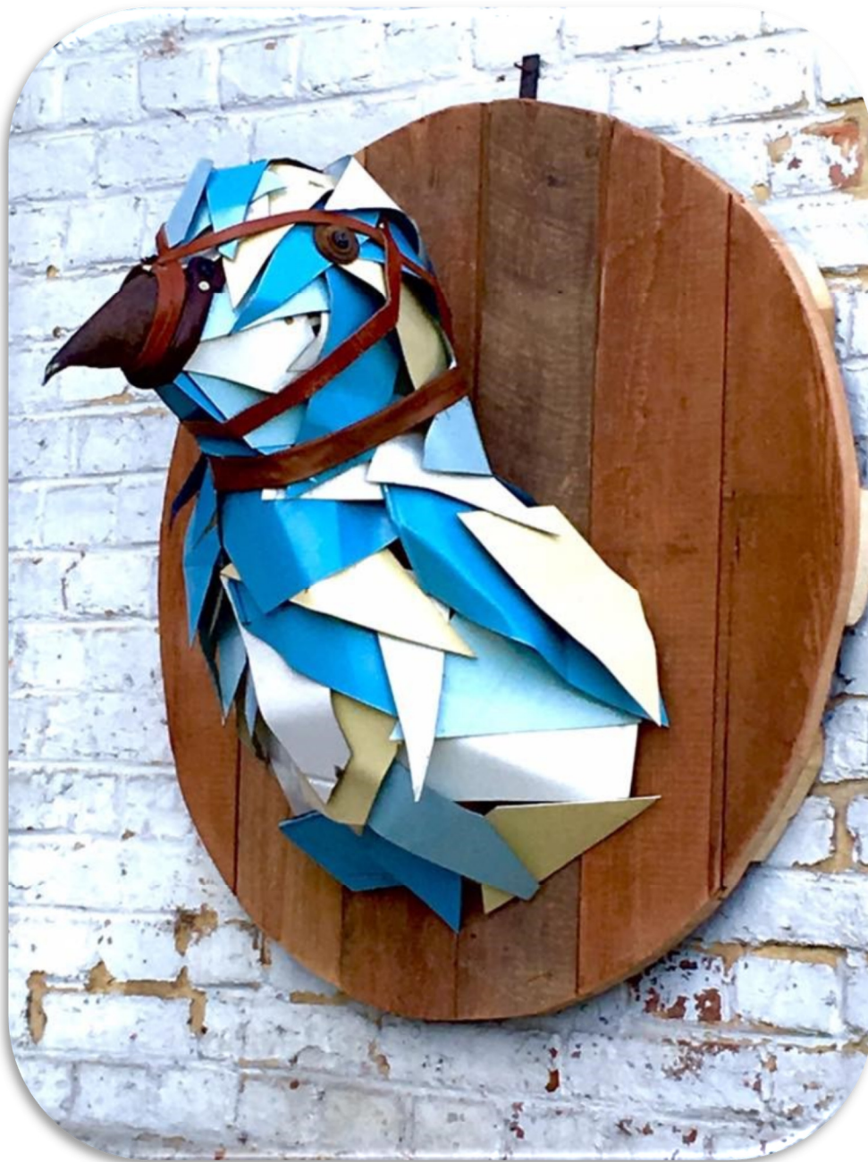
Pigeon par KalbutDSGN