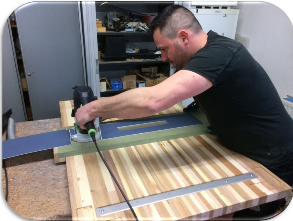
Préparation des panneaux Raymonde pour les tables