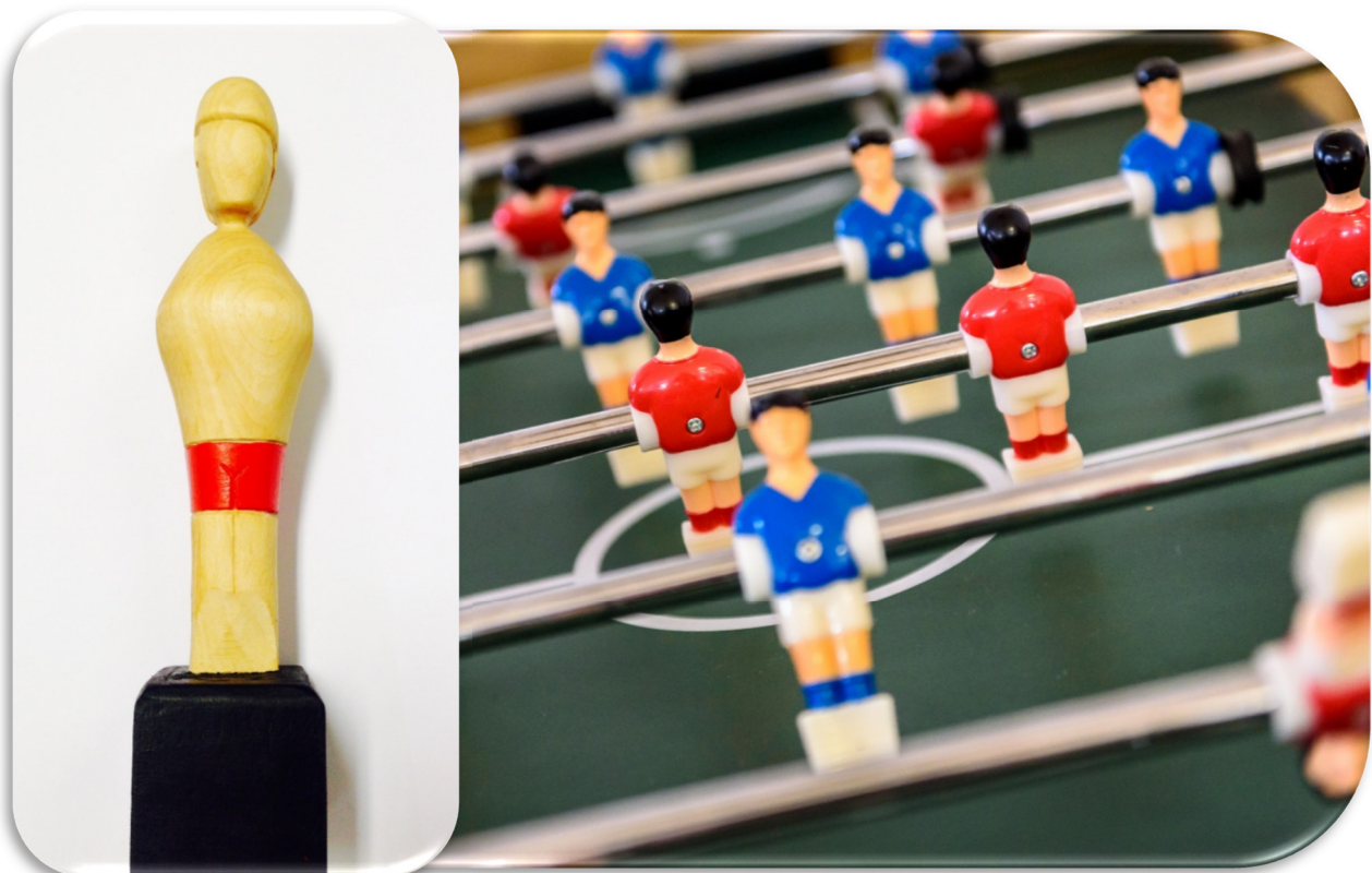
Trophée des vainqueurs sculpté par Anthony Ficarrota, montreur au Musée de la Vie wallonne

Participation gratuite - Inscription au 04/237.90.60