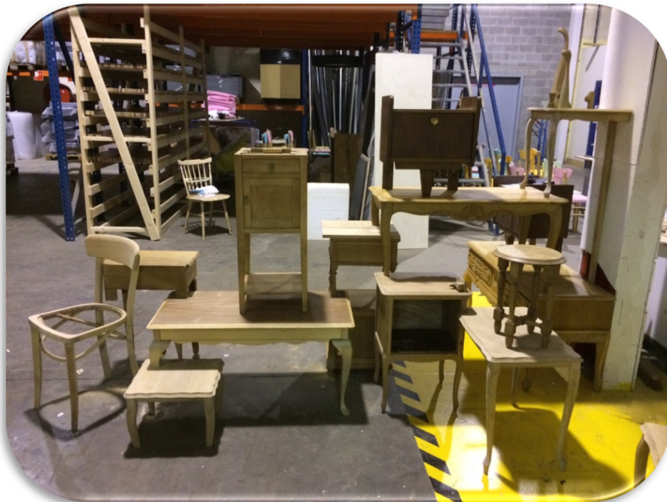
Construction d'une structure de séparation en meubles récupérés