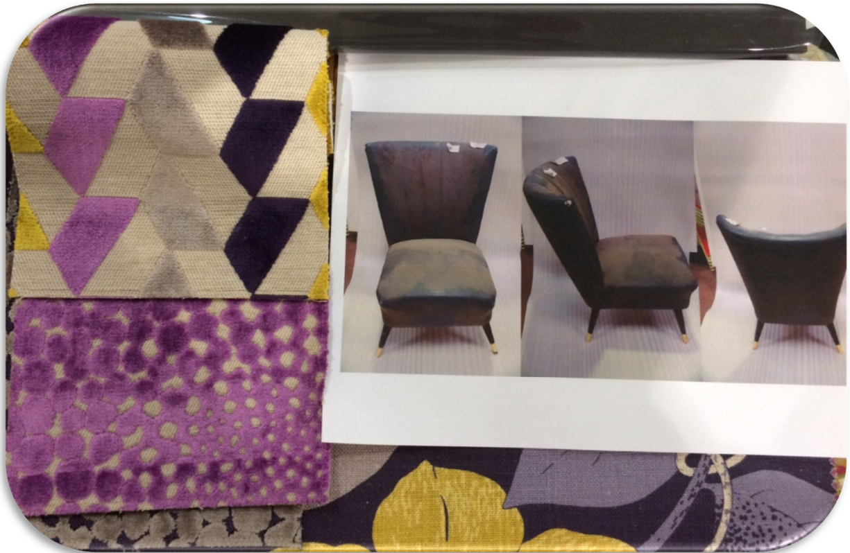
Sélection des tissus pour le garnissage des fauteuils récupérés