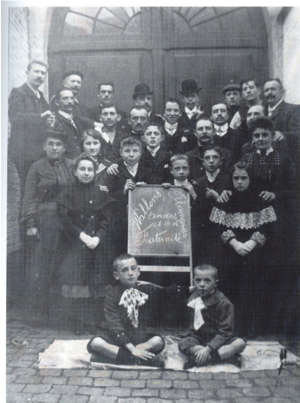
Enfants des lock-outés verviétois hébergés à Anvers

Confiants, les patrons s'engagent dans cette bataille, persuadés que les ouvriers, sans plus aucun moyen de subsistance, ne tiendront que quelques jours. Cependant, la solidarité s'organise grâce aux diverses actions syndicales et une entraide exceptionnelle se manifeste (collecte dans le pays, accueil des enfants des grévistes dans des villes comme Seraing...). Durant ce conflit, les ouvriers restent calmes et pacifiques : aucune émeute n'éclate, la violence ne trouve pas sa place au sein de ce combat.