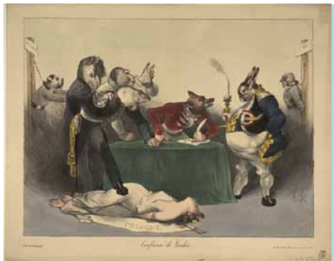
La Conférence de Londres vue en 1832 par le caricaturiste Honoré Daumier. Les lithographies satiriques zoomorphes sont très nombreuses au XIX e siècle. Celle-ci a connu de nombreuses variantes 2 .

Le traité des XVIII articles, assez favorable à la Belgique, est remplacé par celui des XXIV articles à la suite de la désastreuse campagne des 10 jours d'août 1831 (tentative de Guillaume I er des Pays-Bas de mettre fin à l'indépendance belge). Il établit surtout le partage du Limbourg et du Luxembourg. La Belgique le ratifie le 15 novembre 1831, mais le roi Guillaume ne le fera que le 19 avril 1839.