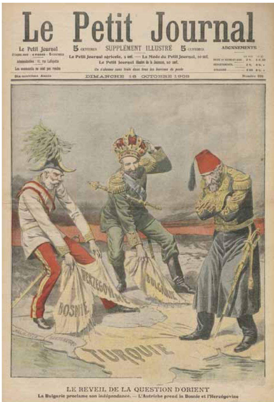
Le Petit Journal. Supplément illustré, 18 octobre 1908