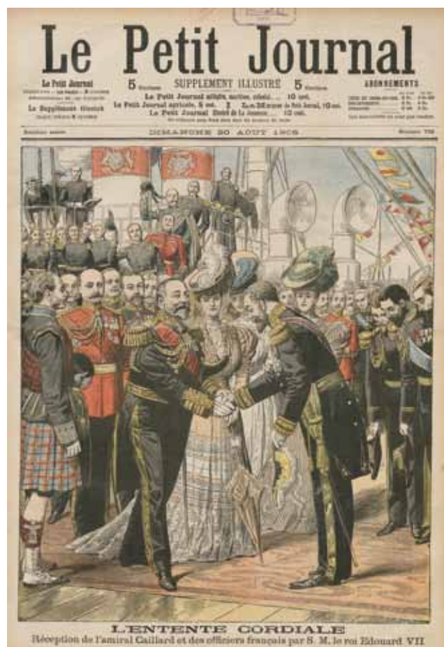
Le Petit Journal. Supplément illustré, 20 août 1905

« L'accord intervenu entre la France et l'Angleterre avait besoin, pour être utilement complété, de ces manifestations mutuelles, de ces visites cordiales dans lesquelles les peuples prennent plus étroitement contact. De tels rapports de cordialité réciproque font tomber les préjugés et les malentendus... » 7