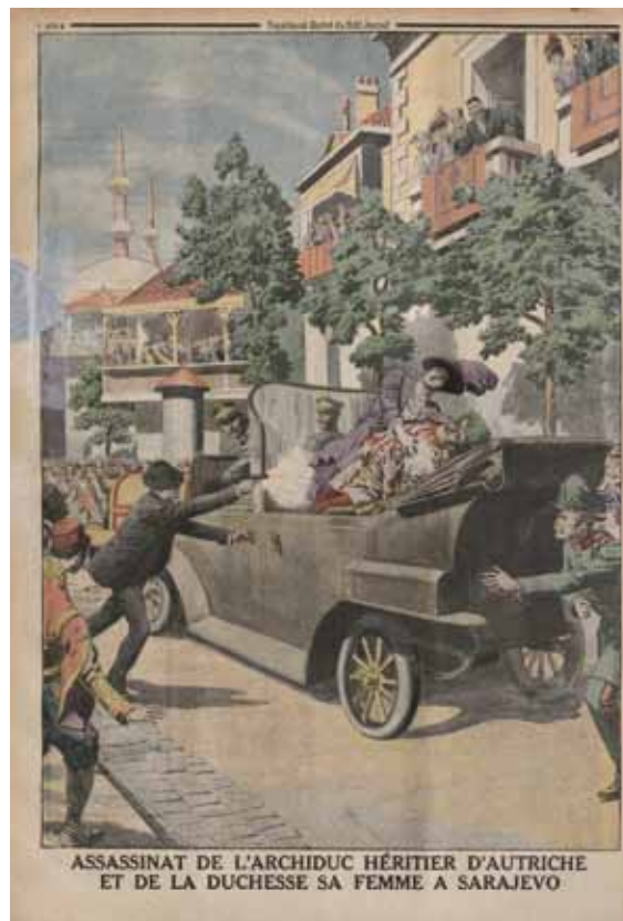
Petit journal. Supplément illustré, 12 juillet 1914, page 8

Un des conspirateurs aurait dit, lors de son procès : « Mon corps flamboyant sera une torche pour éclairer mon peuple sur son chemin vers la liberté. » 8