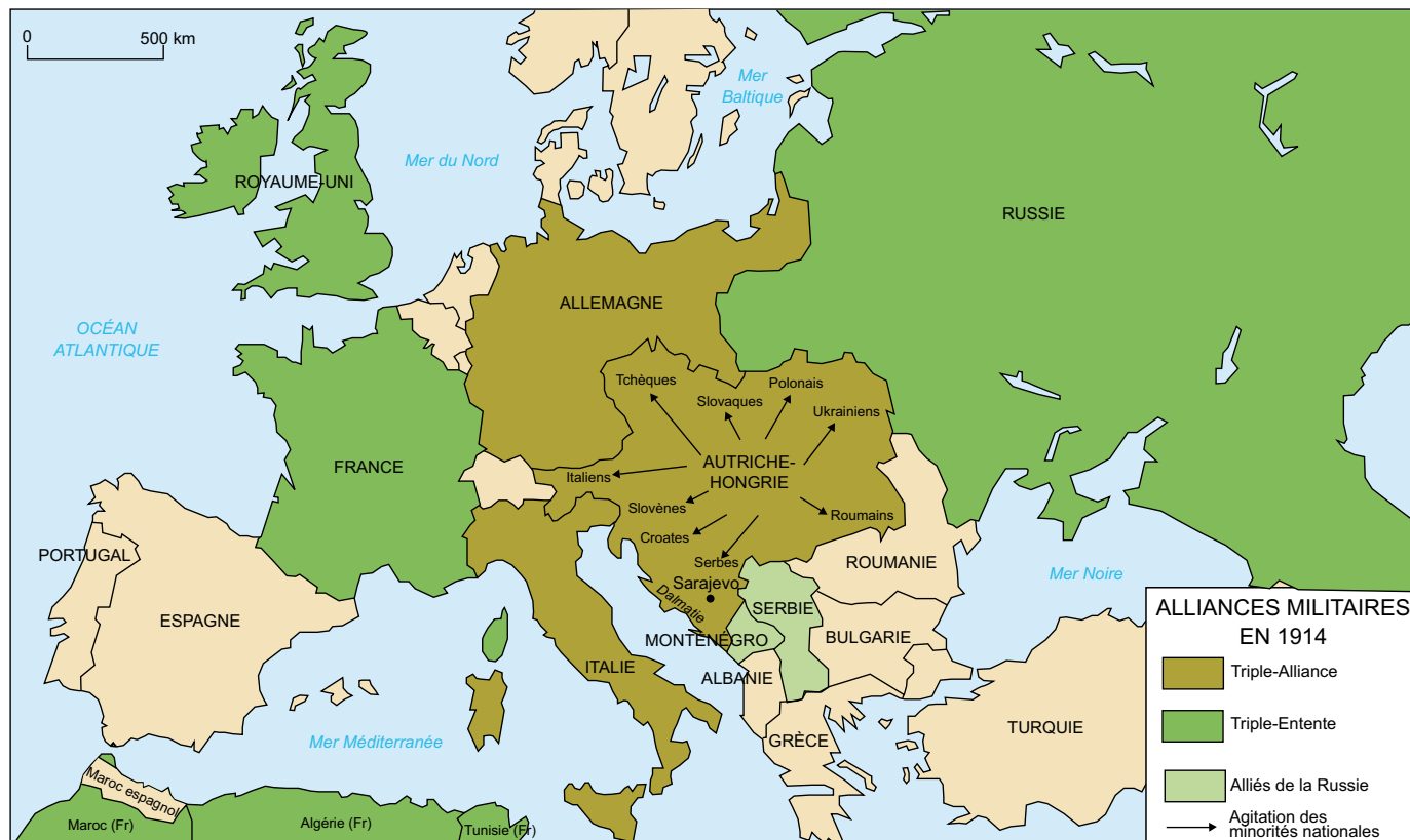
Carte des des accords, ententes et des alliances en 1914

Ces trois derniers pays ne sont donc pas alliés militairement de façon solidaire, ni en cas d'attaque ni même en cas d'agression. Mais ces alliances doubles conduisent à parler a posteriori d'une Triple Entente entre des pays qui ont des intérêts communs, voire des adversaires communs.