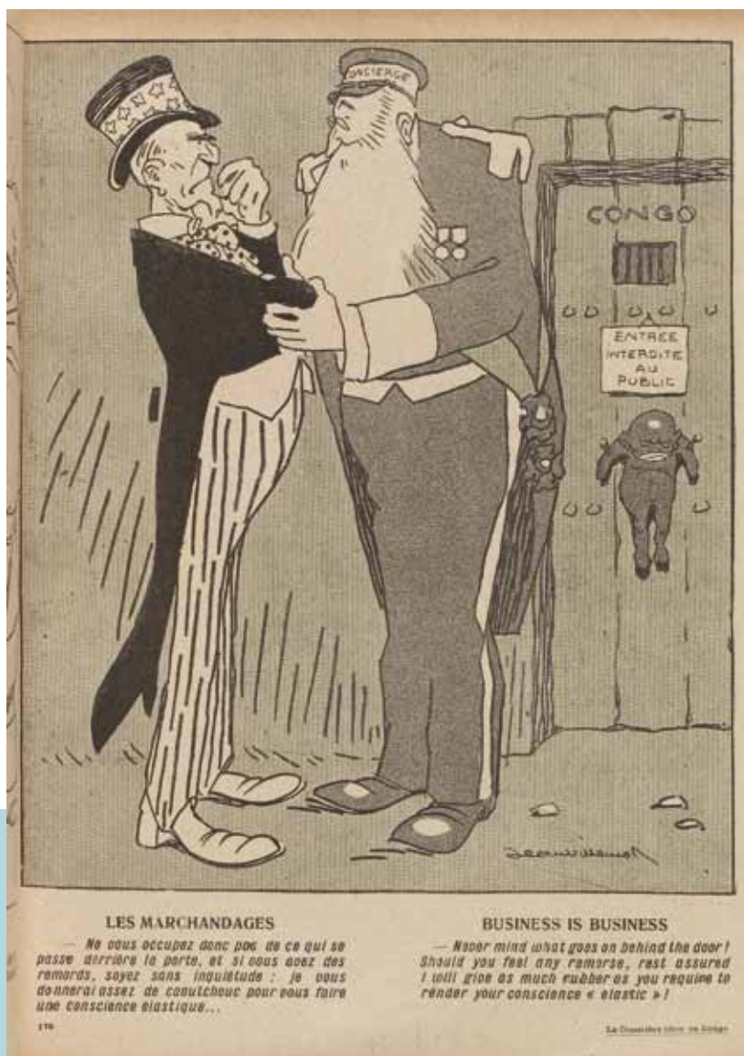
Dessin du journal satirique L'Assiette au beurre , juin 1908

Cette immense colonie, riche et potentiellement très riche, attise les convoitises d'autres pays européens.