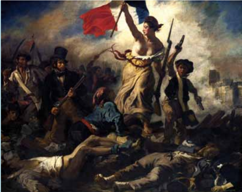
Eugène Delacroix, La Liberté guidant le peuple , 1831

En Europe occidentale, les pays qui n'ont pas encore de régime parlementaire l'adopteront entre 1830 et 1871. La France connaît un essai de monarchie constitutionnelle en 1830, qui sera surnommée la Monarchie de Juillet, et adoptera le suffrage universel en 1848.