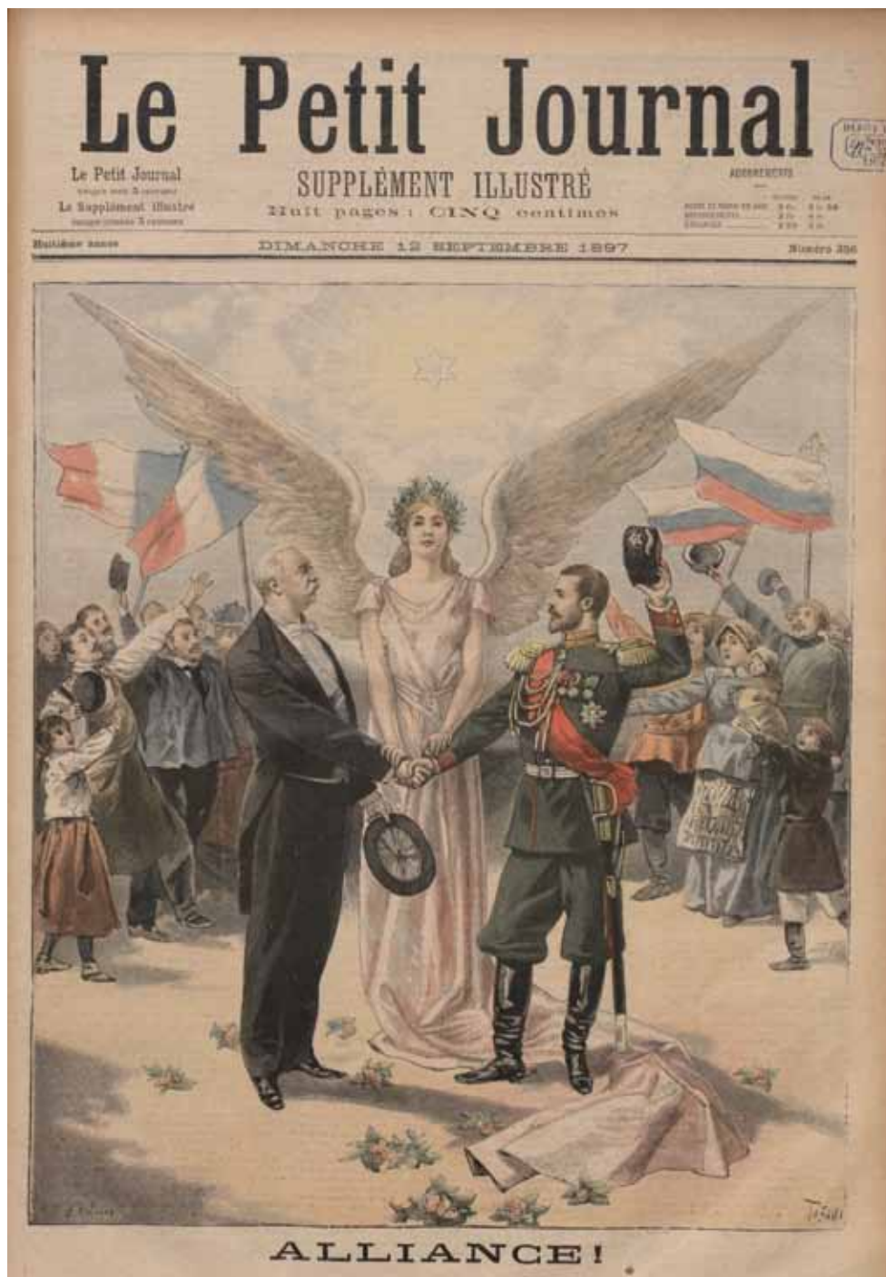
Cette couverture du supplément illustré du Petit Journal du 12 septembre 1897 représente la rencontre du président français Félix Faure et du tsar Nicolas II

« Jusqu'à ce que la France ne trouve des alliés, nous n'avons pas à la craindre », disait le chancelier Bismarck, artisan de la victoire allemande de 1870 sur la France.