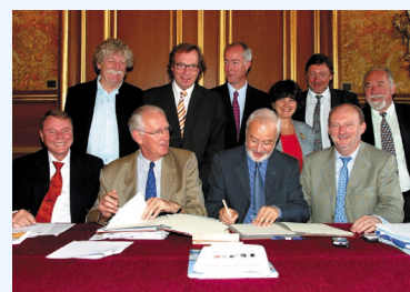
La Députation permanente au grand complet signe la nouvelle programmation 2004-2007 avec les Côtes d'Armor.