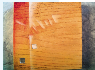
Peinture Raphaël Demarteau

Dans un autre registre, une exposition intitulée Cadeaux se tient à la Maison des Métiers d'Arts, rue des Croisiers 13 à 4000 Liège jusqu'au 31 décembre 2004 inclus. Tout en mettant à l'honneur la créativité et le savoir-faire des artisans de notre belle province, l'exposition propose au public des cadeaux de fin d'année originaux : des pièces uniques à des prix souvent démocratiques dans une grande variété de finitions et de matières. Exposition accessible du lundi au vendredi de 12 à 18 h et le samedi de 11 à 17 h, ouverte le dimanche 19 décembre de 12 à 18 h, les 24 et 31 décembre de 12 à 16, fermée le 25 décembre.