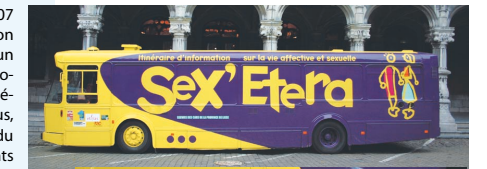
Photos : Le Diabolo-Manques 2 et la nouvelle version du Sex'Etera ont été inaugurés récemment au Palais provincial.

D'octobre 1999 à novembre 2004, ce sont 138 écoles, 1.107 classes et 21.135 élèves qui ont participé à l'opération Diabolo-Manques. Bien plus qu'une exposition, le bus est un outil qui doit favoriser ou renforcer la mise en place d'un projet d'école relatif à l'information et à la prévention des assuétudes. Suite à des adaptations retenues dans le 2 ème bus, Diabolo-Manques sera également accessible aux élèves du dernier cycle de l'enseignement primaire et aux étudiants des établissements scolaires du secteur de l'enseignement et de l'aide sociale.